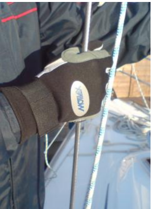
Auch bei kaltem Wetter haben Sie alles im Griff! Sorgen Sie für Sicherheit an Bord.

Große Modelauswahl & Super Verarbeitung!