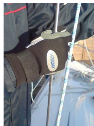
Auch bei kaltem Wetter haben Sie alles im Griff! Sorgen Sie für Sicherheit an Bord.

Handel mit Bootszubehör und Wassersportartikeln