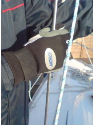
Auch bei kaltem Wetter haben Sie alles im Griff! Sorgen Sie für Sicherheit an Bord.

Große Modelauswahl & Super Verarbeitung!